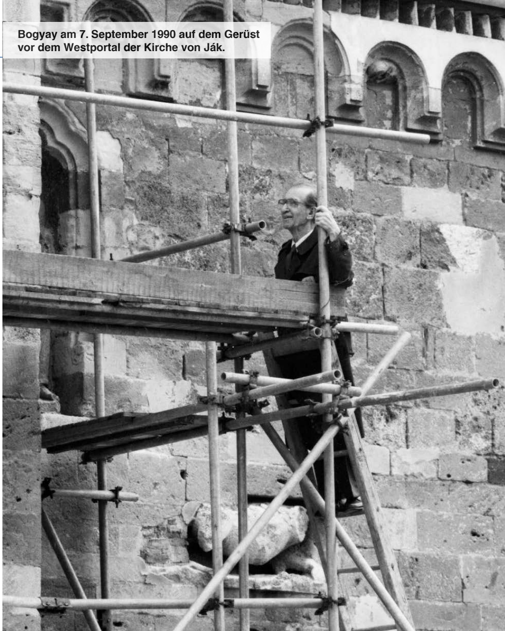
Bogyay am 7. September 1990 auf dem Gerüst vor dem Westportal der Kirche von Ják.

lehrter. Lengyel listet im Anhang der Biografie 644 Titel wissenschaftlicher Publikationen von Bogyay auf. Schwerpunkte bilden Forschungen zu Kunstwerken der Árpádenzeit wie die Heilige Ungarische Krone, die Porta Speciosa in Esztergom oder die romanische Abteikirche in Ják. Er schrieb eine Biografie über König Stephan I., die er sowohl auf Deutsch als auch auf Ungarisch herausgab. Seine „Grundzüge der Geschichte Ungarns“ erschienen von 1967 bis 1990 in vier Auflagen, 1993 auch auf Ungarisch, und gelten bis heute als ein Standardwerk, insbesondere im Hinblick auf die frühe, mittelalterliche sowie frühneuzeitliche Geschichte des Landes.